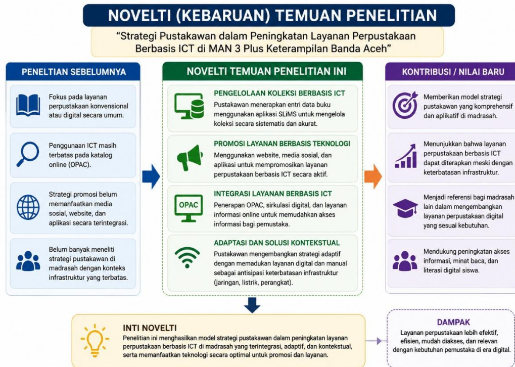
Gambar 2. Novelti Penelitian, 2026